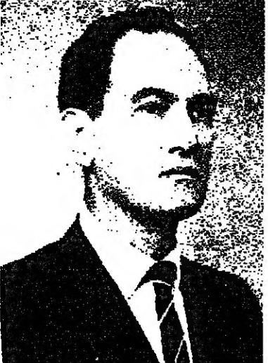
عضو الكنيست أمنون لين

الكنهن بطورتها ونجاحها ومدى تأثيرها على العلاقات بين ابناء الشعيين . وبين المواطنين العرب ودولة اسرائيل . ان شخصا واحدا يستطيع نشر البلبلة من حين يحتاج الامر الى مجموعة كبيرة من الناس لحصرها والقضاء عليها .